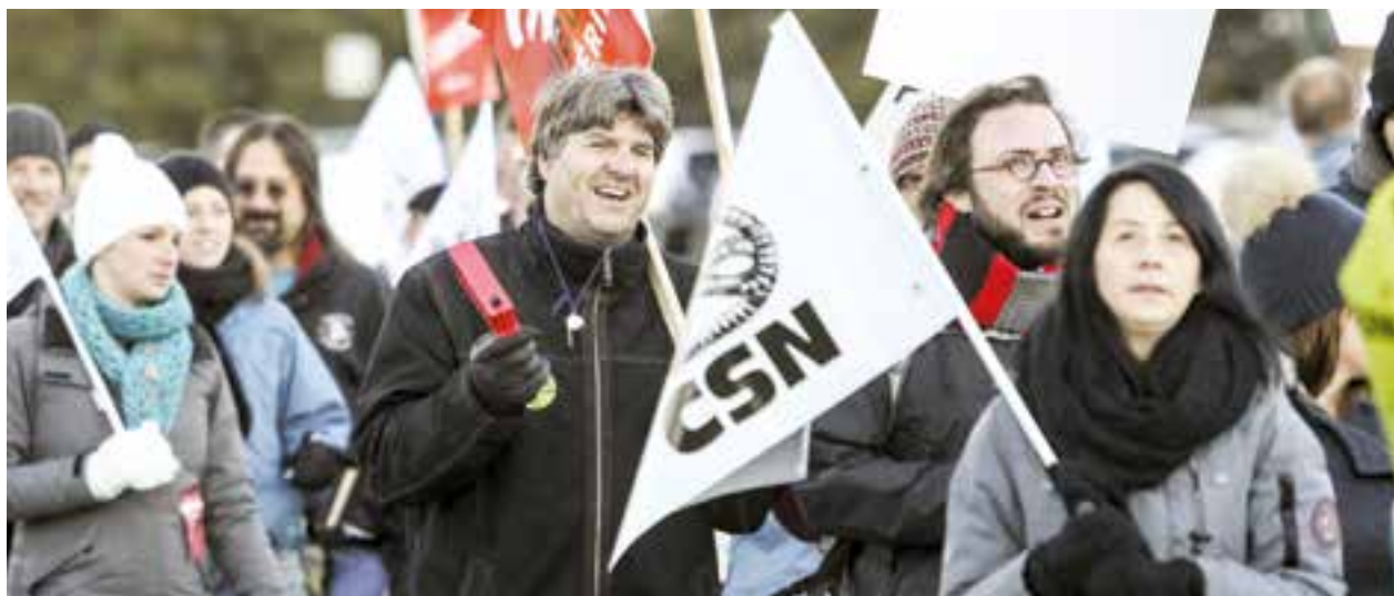
Octobre 2015 - Grève du secteur public

de cours de l'UQO, comme leurs collègues des autres universités, assument une part importante de l'enseignement au premier cycle, cette proportion atteignant jusqu'à 62 % à l'UQO. Malgré l'importance de leur contribution, ils demeurent sous-payés. En effet, les chargé-es de cours ne reçoivent que 60 % du salaire d'un professeur. Mais il n'y a pas que les salaires qui font l'objet de négociation. Les chargé-es de cours revendiquent également une amélioration de leurs conditions d'enseignement : un régime d'emploi stable (leur contrat actuel ne dure que trois mois), des bureaux pour favoriser l'encadrement de leurs étudiantes et étudiants, des postes informatiques et de l'aide pédagogique à l'enseignement.