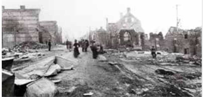
Le grand feu d'avril 1900