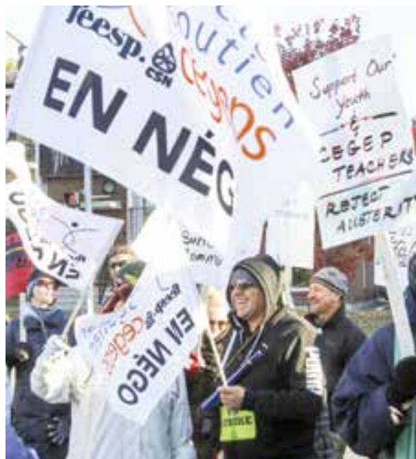
Octobre 2015 - Grève du secteur public

Organiser des journées de grève de cette ampleur n'est pas chose facile pour les syndicats. Des contraintes de toutes sortes, logistiques et organisationnelles, se posent constamment. Cependant, nous pouvons tous ensemble être fiers de ce mouvement qui, malgré la grande diversité des secteurs de travail que nous occupons, a su trouver le chemin de l'unité.