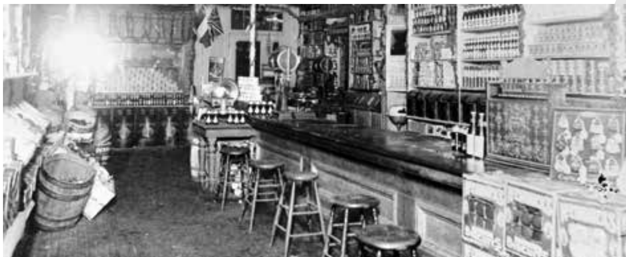
Intérieur du magasin Lafèche. L'Association ouvrière puis le conseil central y seraient fondés et y tiendraient leurs assemblées à l'étage du dessus (Ville de Gatineau)