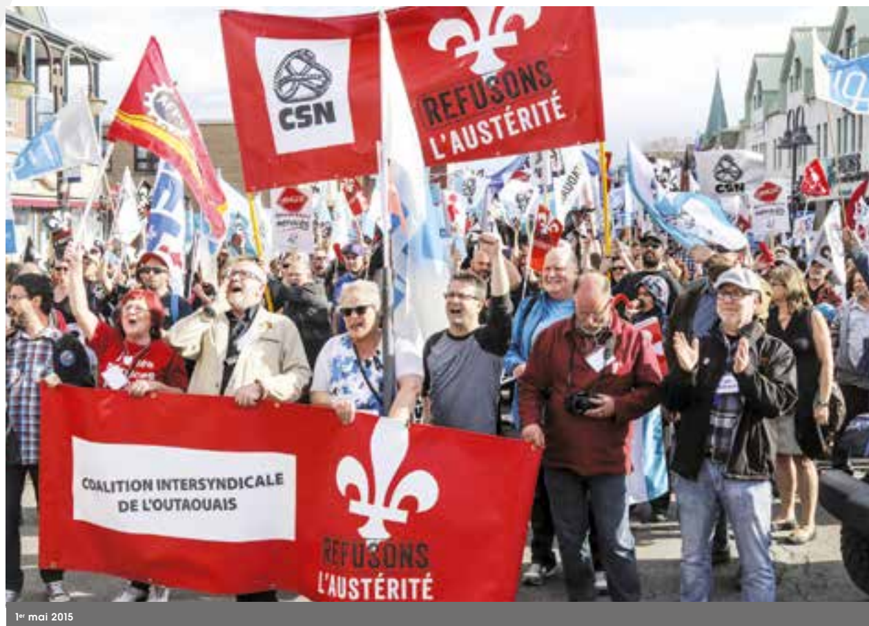
1 er mai 2015

Dans la foulée des manifestations, nous ne pouvons passer sous silence la Journée internationale des travailleuses et travailleurs de 2015 qui est un rassemblement historique. Rarement un 1 er mai dans la région n'est souligné aussi massivement (plus de 2000 manifestants). Cette démonstration de force, placée sous le signe de la lutte contre l'austérité, s'est déroulée dans le contexte des négociations du secteur public. L'organisation de cette manifestation demande plusieurs rencontres, auxquelles assiste l'ensemble des organisations syndicales de la région, y compris celles qui ne font pas partie du Front commun. Les réunions se tiennent dans nos locaux sous la coordination du Conseil central.