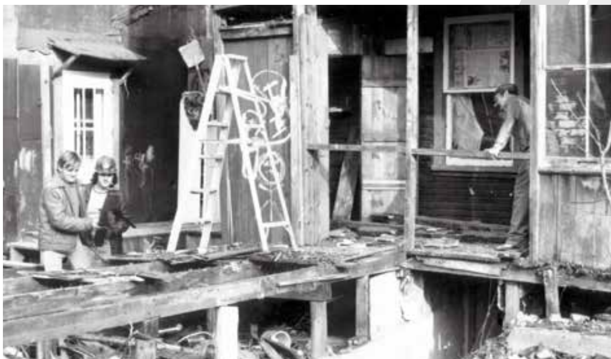
Destructions causées par les expropriations des années 70, en vue de la construction des édifices fédéraux (BNAQ)