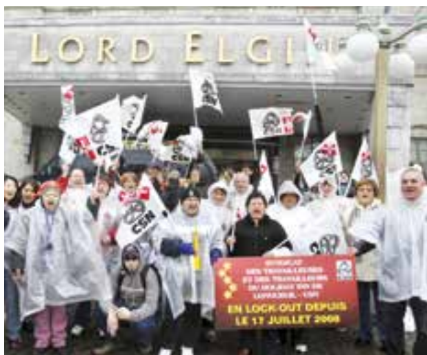
Avril 2009 - Appui aux travailleurs du Holiday Inn de Longueuil