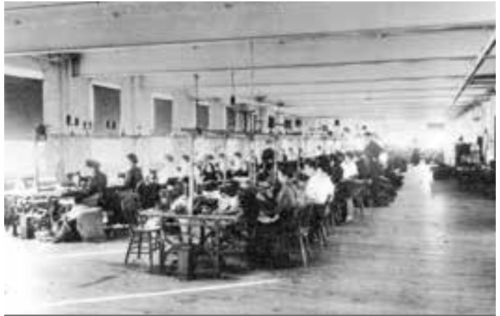
Ouvrières de la Wood's Textile à Hull, 1909