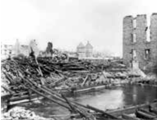
Le grand feu d'avril 1900