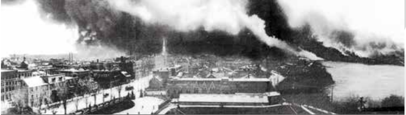
Le grand feu d'avril 1900