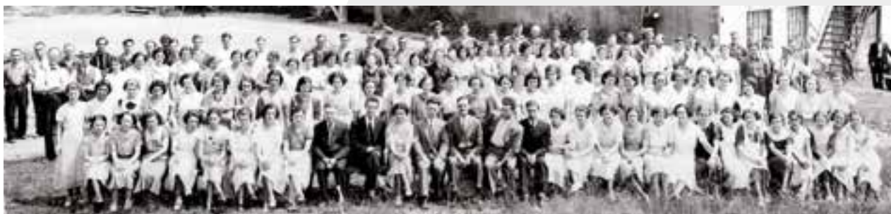
Groupe d'ouvrières de E. B. Eddy vers 1910 (BNAQ)