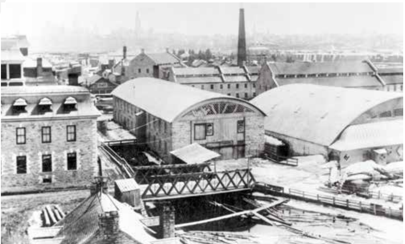
Usine d'E. B. Eddy à Hull, début du XX e siècle (Ville de Gatineau)