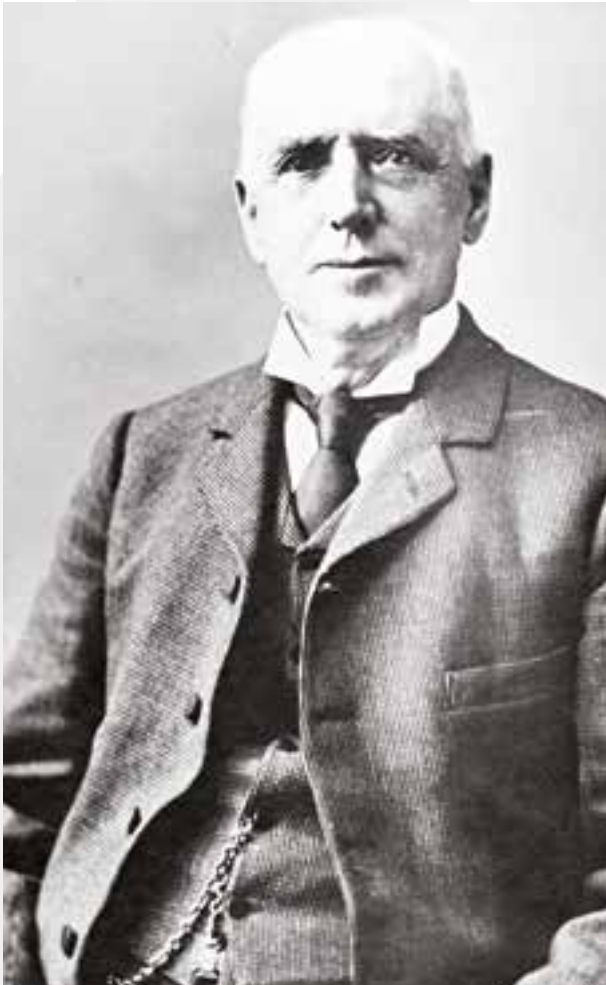
E.B Eddy, vers 1890, alors qu'il était aussi maire de Hull (Ville de Gatineau)