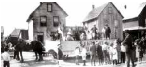
Char allégorique du syndicat des allumettières au défilé de la Fête du travail de 1924

Le Conseil central, comme tous les syndicats catholiques, prônait plutôt la bonne entente, le compromis et le respect des autorités, surtout religieuses. À titre d'exemple, tous les dirigeants des syndicats catholiques locaux doivent obligatoirement faire partie du Cercle Benoît XV et assister chaque année à une retraite fermée. Durant les années 30 en particulier, ces retraites seront un bon indicateur des orientations idéologiques du Conseil central.