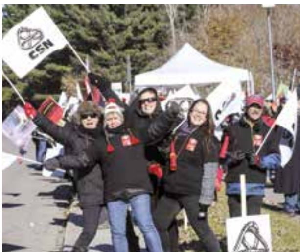
Octobre 2015 - Grève du secteur public