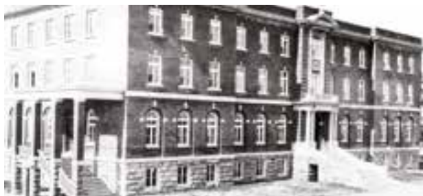
Maison des retraites fermées, que tous les délégués syndicaux devaient suivre, 1950