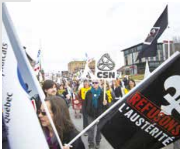
1 er mai 2015

Finalement, une entente de principe qui prévoit des augmentations salariales, une amélioration des droits parentaux et des dégagements supplémentaires pour les activités syndicales est entérinée par les professeur-es. De plus, le syndicat obtient l'équité dans les conditions de travail pour les professeur-es du campus de Saint-Jérôme.