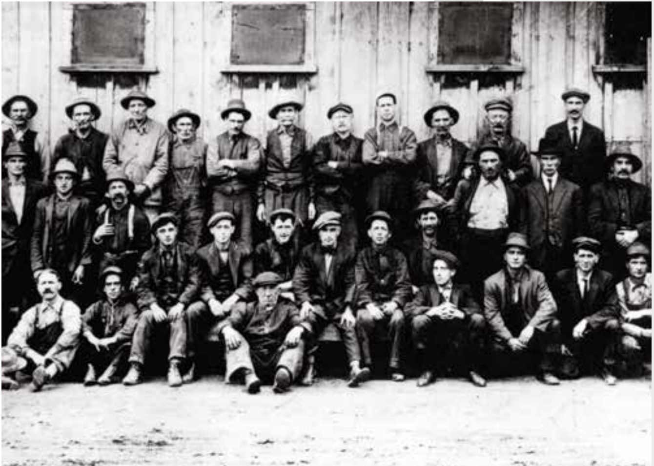
Groupe d'ouvriers de E. B. Eddy vers 1910