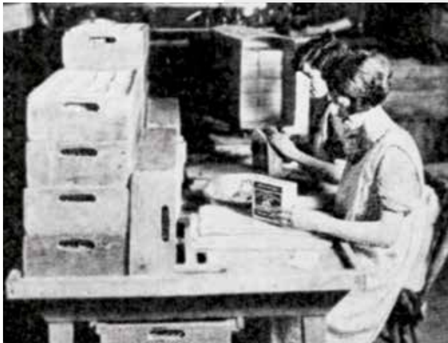
Allumettières, durant la Première Guerre mondiale, 1914-1918