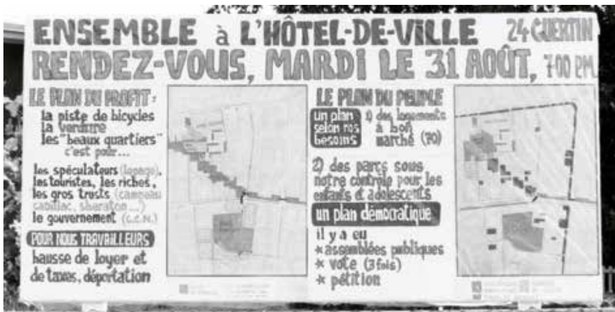
Appel à la mobilisation citoyenne et ouvrière contre les expropriations (BNAQ)

d'habitation, des associations de chômeurs, ou de défense des droits sociaux comme l'ADDS, un refuge pour itinérants, le Gîte-Ami, et combien d'autres groupes populaires sont nés de cette bataille, et existent toujours. Du même coup, cette invasion du fédéral forcera le gouvernement provincial à s'intéresser à l'Outaouais et à remédier, au moins en partie, au retard institutionnel de la région, surtout en santé et en éducation.